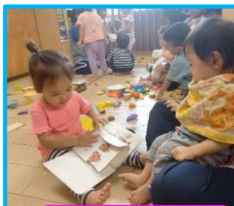
うさぎ組さんに絵本読んであげるよ!