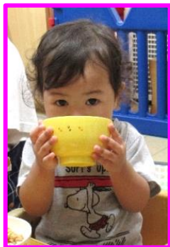
自分でスープのめるよ!