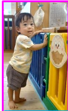
カレーパンマン見つけて歩いてきたよ!

*園をお休みする場合、登園が遅れる場合は、9時30分までに必ず電話連絡してください。 *5月11日(土)に、親子遠足を予定しています。ご家族皆様でご参加ください。 *6月4日(火) 前期尿検査提出日 *6月18日(火) 内科検診