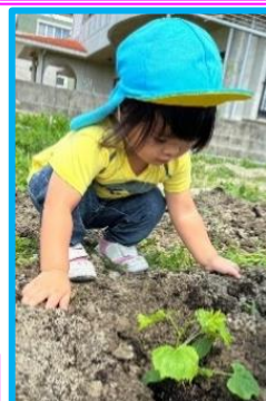
畑に植えた夏野菜『おおきくな〜れ』