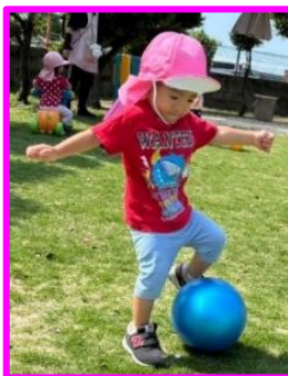
畑の広場でボール遊びしたよ!