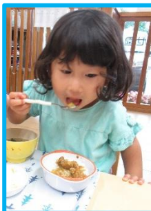
自分でご飯を食べるよ!